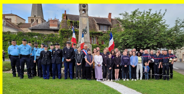
Commémoration 8 mai 1945 en présence d'élèves gendarmes de l'école de Montluçon.