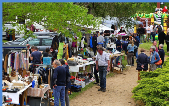
Vide grenier du 8 mai du comité des Fêtes.